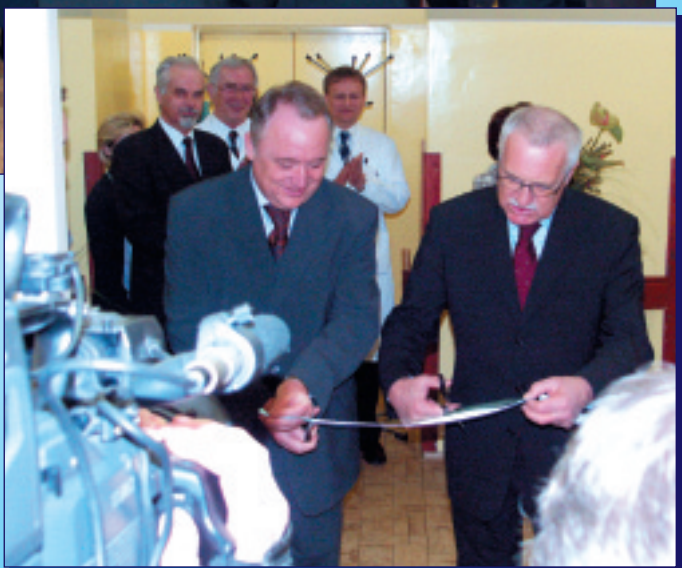
Návštěva prezidenta republiky Václava Klause na Neurologické klinice Fakultní nemocnice v Hradci Králové u příležitosti uvedení do provozu nového monitorovacího systému jednotky intenzivní péče, 2. 3. 2005.